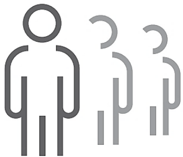
Saman í frástøðu